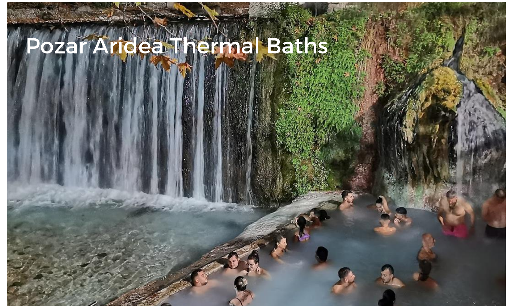
Pozar Aridea Thermal Baths